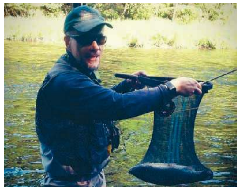
Kunnanjohtaja viihtyy vapaa-ajallaan muun muassa kalassa Kynäsjoella.