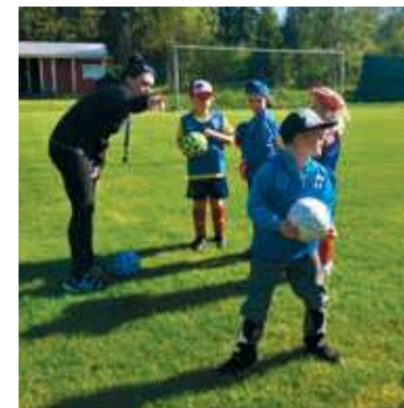
Pomarkun Ura järjestää tällä hetkellä perhefutista, 2017–2019 syntyneiden joukkue-toimintaa, 2015–2016 syntyneiden jalkapallotreenejä sekä nyt uutena tuttavuutena kävelyfutista.