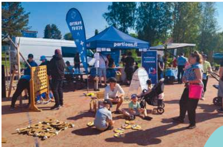
Pomarkun Polunkävijöillä oli Pihkassa Pomarkkuun -tapahtumassa vuonna 2024 oma pisteensä.

Jalkapallon hurmaan päästään 27.-28. kesäkuuta, kun Pomarkun jalkapallokentällä järjestetään