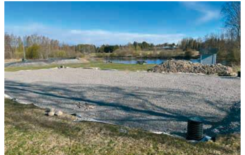
Padelkentän pohjat on jo tehty. Tavoitteena on saada kenttä auki kesäkuussa.

Pomarkun padelkentän varaukset tehdään netissä Playtomic-järjestelmän kautta, josta on mahdollisuus etsiä ja löytää otteluita ja kenttiä ympäri maailmaa. Varauksen voi tehdä silloin, kun itselle sopii. Maksun jälkeen saa koodin, jolla saa kentän portit auki.