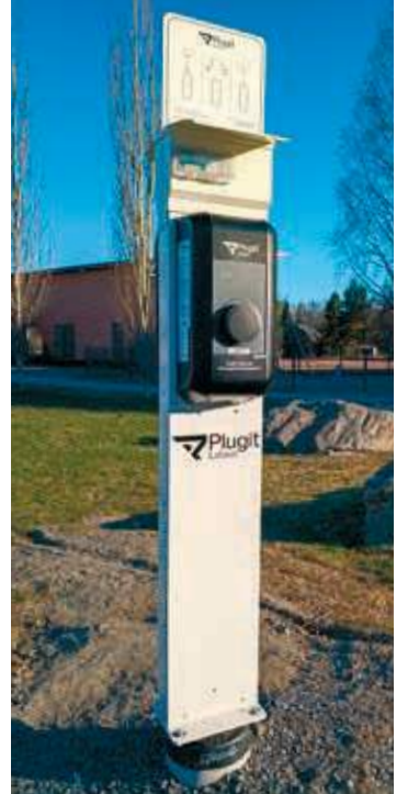
Pomarkun monitoimihallin pihasta löytyy sähköautojen latauspiste.

2.6. 18:00 Naiset: PomPy - MaJu 6.6. 13:00 Naiset: PomPy - Fera 9.6. 18:00 D-pojat: PomPy - Manse 15.6. 18:00 Naiset: PomPy - UPV 2 17.6. 18:00 D-tytöt: PomPy - Fera D12 29.6. 18:00 D-tytöt: PomPy - HaJy siniset 5.7. 13:00 C-pojat: PomPy - Jkl Kirjunnut 12.7. 17:00 Naiset: PomPy - NoPe 15.7. 18:00 D-pojat: PomPy - KoU D musta 16.7. 18:00 Naiset: PomPy - UPV 3 19.7. 10:00 C-pojat: Jkl Kirjunnut - PomPy 19.7. 14:30 C-pojat: PomPy - Jkl Kirjunnut 19.7. 18:00 Naiset: PomPy - Kumuri 26.7. 12:00 D-pojat: PomPy - SMJ P14 26.7. 15:30 D-pojat: PomPy - SMJ P14 30.7. 18:00 D-tytöt: PomPy - LaJy D-12 1.8. 17:00 D-pojat: PomPy - SMJ P12 Punainen 4.8. 18:00 D-tytöt: PomPy - HaJy keltaiset 7.8. 18:00 C-pojat: PomPy - KaMa 9.8. 15:30 C-pojat: PomPy - KoU C valkoinen 13.8. 17:30 Naiset: PomPy - Pesäkarhut 2 16.8. 17:00 Naiset: PomPy - Pesäkarhut 21.8. 18:00 Naiset: PomPy - RuoPi 22.8. 17:00 D-tytöt: PomPy - MaJu D14 26.8. 17:30 Naiset: PomPy - KK-V 5.9. 12:30 Naiset: PomPy - YPA NAS