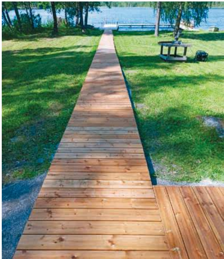
Uimaranta on kesällä suosittu nuorten kokoontumispaikka.

Pomarkun nuokkarin tärkein tehtävä on tarjota turvallinen tila. Siellä ei tarvitse olla paras riittää, kun tulee paikalle. Sohvilla voi rentoutua tai vaikka ottaa erän biljardia tai vain vaihtaa kuulumiset kavereiden kanssa. Monelle meistä nuokkari onkin se ”toinen olohuone”, jossa kotiolut ja kouluasiat unohtuvat hetkeksi.